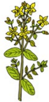
ST. JOHN'S WORT