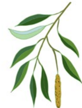
WHITE WILLOW BARK